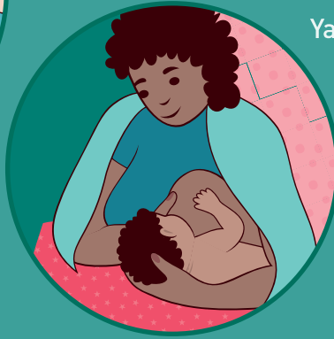
Koltuk altı pozisyonu